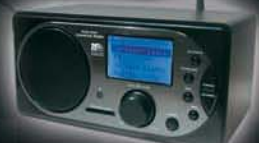
Aparato de Radio Internet y FM con capacidad Wi-Fi

• Sintonizador de emisoras de Internet y Radio FM, con función Wi-Fi para conectar de forma inalámbrica con el Router y acceder a radios de todo el mundo. • El equipo también reproduce mediante tecnología streaming la música MP3 y WMA que tenga almacenada en su PC. • Además dispone de una ranura para tarjetas de memoria SD para reproducir archivos MP3, OGG y WMA alojados en ella.