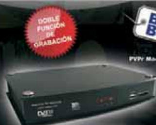
PVP: Modelo 160GB

• Reproductor DVD universal y sintonizador de TDT en una sola unidad. • Compatible con DVD Video, archivos de Video Comprimido, música MP3 e imágenes JPEG. • Sintonización automática de canales de TV Digital Terrestre. • Conexión USB para reproducir archivos desde dispositivos externos. • Atractivo diseño en carcasa compacta de reducidas dimensiones. • Salida de audio coaxial y completo mando a distancia incluido.