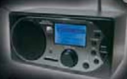
Apoyado de Radio-Internet y FM con capacidad WiFi

• Sintonizador TDT con posibilidad de grabar dos programas de televisión simultáneamente, o de bien grabar un programa mientras se ve otro. • Reproduce archivos de video comprimido, música e imágenes que pueden almacenarse en su disco duro interno (disponible en varias capacidades). • Conexión al PC para intercambio de archivos multimedia y de grabaciones televisivas. • Reproducción multimedia desde dispositivos USB y tarjetas de memoria SD.