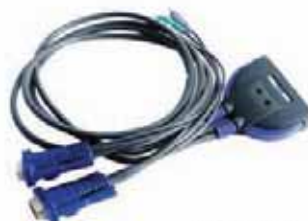
Ref. CS 62Z