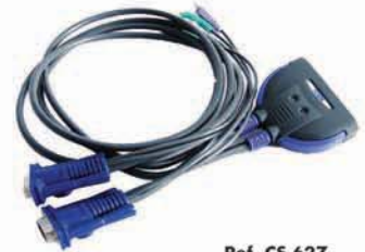
Ref. CS 62Z